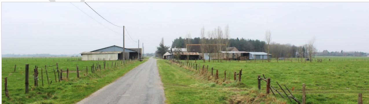
© VIGNES PAYSAGE 2023 – la ferme de la Grande Cour, le long de la Route de Rochevieux.