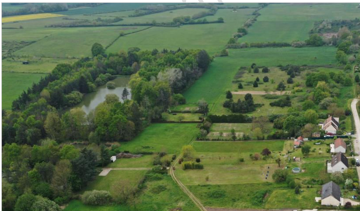
© parenthesesURBaineS 2023 – vue aérienne sur la plaine alluviale