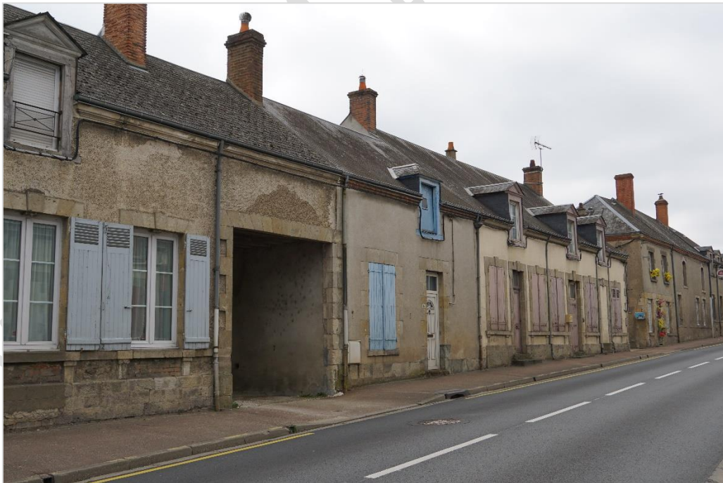
© parenthesesURBaineS 2023 – constructions dans le centre bourg, Grande rue