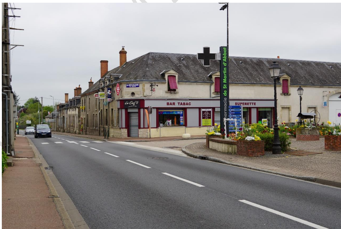
© parenthesesURBaineS 2023 – commerces dans le centre bourg, Grande rue