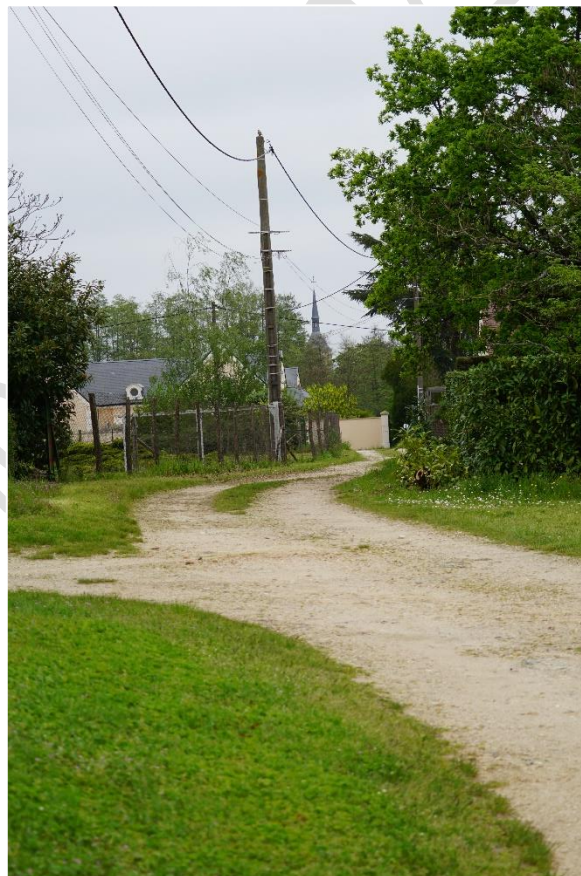
© parenthesesURBaineS 2023 – chemin piéton du centre bourg