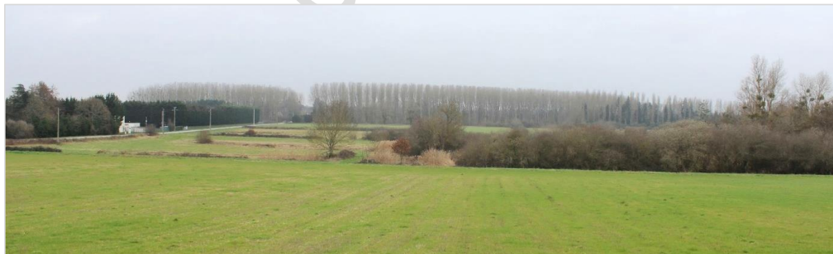
Vue sur la plaine alluviale depuis le balcon naturel situé dans le prolongement de la salle des fêtes. Les rideaux de peupliers constituent de grands rideaux qui limitent la vue en direction de la plaine alluviale de la vallée de la Loire.