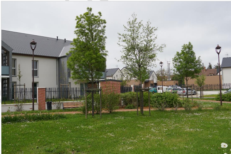
© parenthesesURBaineS 2023 – constructions récentes dans le centre bourg, Grande rue