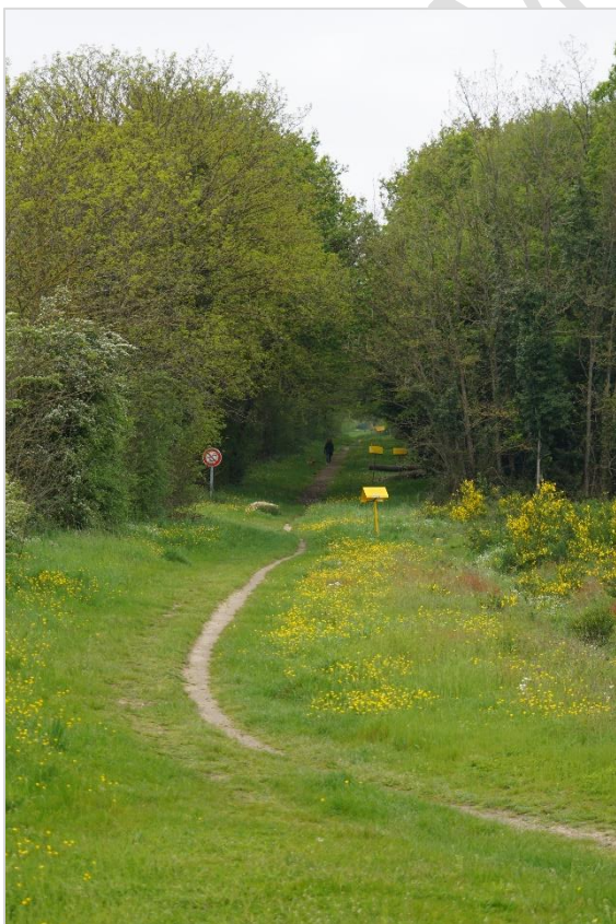
© parenthesesURBaineS 2023 – voie douce Rue des Petits Maux