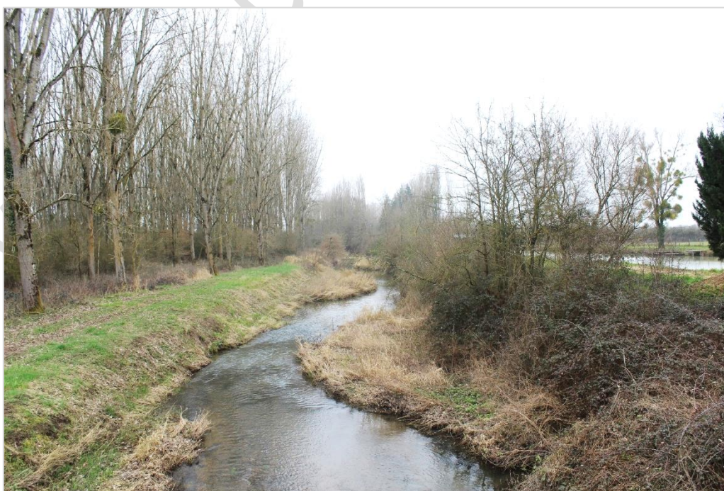
© VIGNES PAYSAGE 2023 - La Bonnée en limite communale depuis la route de Germigny